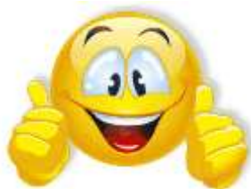
Klašu vidējie vērtējumi 2015./2016. m. g. I semestrī

Ikviens no mums ir spējīgs sagādāt prieka un laimes mirkli otram. Atcerēsimies par to pēc iespējas biežāk, jo, darot priecīgus citus, arī mēs paši kļūstam priecīgāki! Ātri pagāja pirmais pusgads skolā, šajā avīzes numurā gribas pieminēt dažus spilgtākos skolā notikušos pasākumus, ekskursijas un notikumus. Lai veiksmīgs otrs pusgads, labas sekmes, pacietību un iedvesmu jums, skolēni, vecāki, skolotāji un tehniskie darbinieki, novēl avīzes redakcijai.