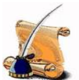
Teksts: K.Zizlāne