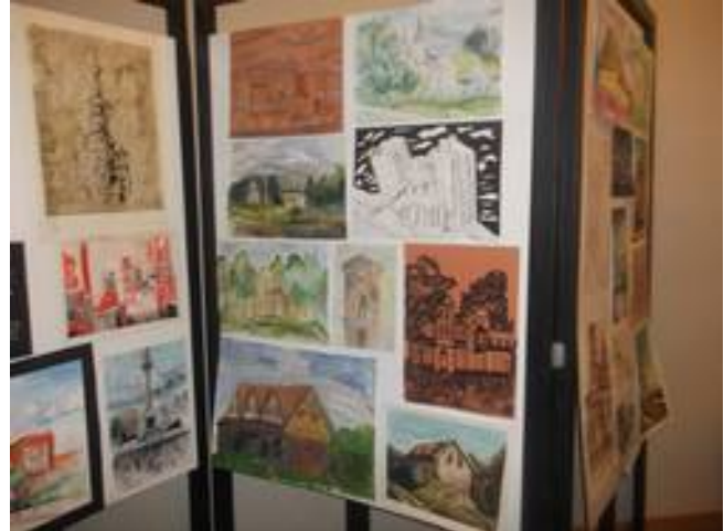
Teksts un foto: G. Pedele.